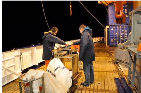
Planktonnetz für verschiedene Wassertiefen